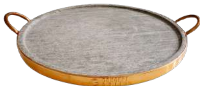
PEDRA PARA PIZZA