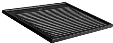
CHAPA PARA HAMBURGUER