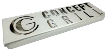
S M O K E R B O X